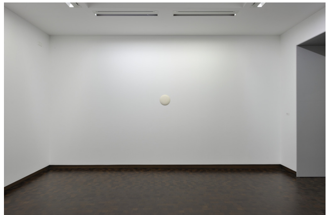
Zaaloverzicht Plug In #47.

'Plug In #47' is een hommage aan de conceptuele kunstenaar Ian Wilson die zich sinds 1968 bezighoudt met gesproken taal als kunstvorm. Aanvankelijk speelde Wilsons artistieke zoektocht zich geheel af binnen het monochroom, waarbij schilderkunstige en perceptuele kwesties hem bezighielden. Het object 'Zonder titel' (1967) van fiberglas en wit pigment werd recentelijk door het Van Abbemuseum aangekocht. Begin 1968 ontstonden zijn laatste fysieke objecten: 'Circle on the Floor' en 'Circle on the Wall', die enkel uit een getekende contour van respectievelijk krijt en potlood bestaan.