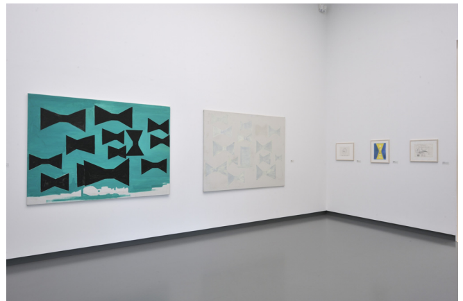
Zaaloverzicht Plug In #43.