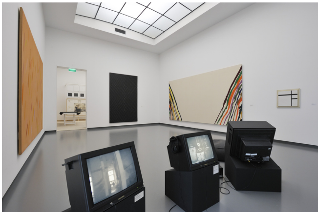
Zaaloverzicht Plug In #46.

In 'Plug In #46. Acts of Non-Aggression' legt gastconservator Shepherd Steiner nieuwe relaties tussen schilderkunst en performance uit de jaren zestig en zeventig in Amerika. Steiners uitgangspunt is 'close reading', een methode ontleend aan de literaire kritiek, waarmee hij het kunstwerk op minutieuze wijze analyseert door het object zelf als uitgangspunt en leidraad te nemen en dit uiterst nauwkeurig visueel te analyseren. Het Van Abbemuseum nodigde Steiner uit, die niet eerder een tentoonstelling samenstelde, om een presentatie te maken op basis van de resultaten van 'close reading'. Steiner schreef voor deze presentatie een tekst om de theoretische en filosofische vooronderstellingen, waarop zijn variabele wijze van het benaderen van individuele kunstwerken is gebaseerd, toe te lichten. Deze benadering komt niet alleen tot uitdrukking in de tekst, maar ook in de presentatie zelf, in de visuele overeenkomsten en verschillen tussen de getoonde werken.