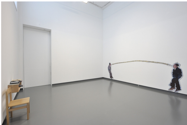
Zaaloverzicht Plug In #42.

In deze ruimte van 'Plug In' staat steeds één werk uit de museumcollectie centraal. De titel verwijst naar de één op één relatie tussen het werk, de zaal en de bezoeker. In de ruimte staat één stoel waarop de bezoeker kan plaatsnemen om in alle rust het werk te bekijken, informatie over het werk door te nemen en na te denken. Gastconservator Marjon de Groot: "Het werk van Ger van Elk laat zich moeilijk in een hokje plaatsen. Het begint al bij zijn techniek, die vaak een mix is van diverse media. Zijn thema's vindt hij binnen de kunst zelf. Wat is de positie en de rol van een kunstenaar? Wat gebeurt er in een afbeelding? Hoe verhoudt een beeld zich tot de werkelijkheid? Zijn benadering is serieus en humoristisch tegelijkertijd. In 'Push Nose Balance Sculpture' is het Van Elk zelf die twee maal boven de plint zweeft en probeert de bamboeboom gespannen te houden. De kunstenaar in een hachelijke positie, geconfronteerd met zichzelf, in een onmogelijke opgave? [...]"