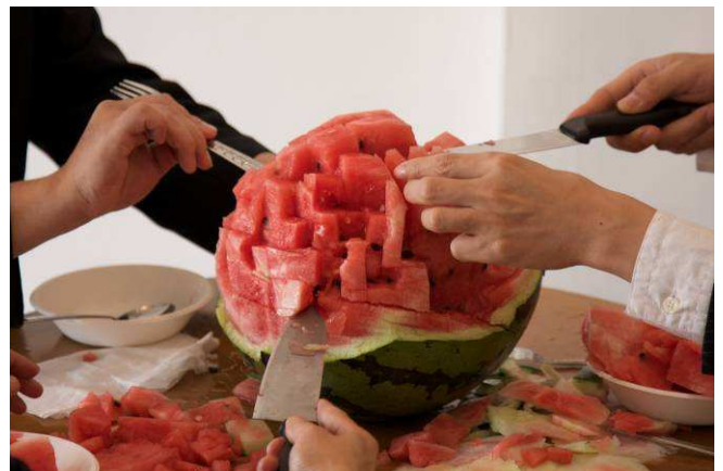
Xijing Men, I Love Xijing , 2009, performance. The Urban Planning of Xijing .

De Thaise kunstenaar Surasi Kusolwong installeert een hele ruimte vol afvaldraden waar iedere week een gouden ketting wordt verstopt voor een gelukkige vinder. De vinder mag de ketting houden, zodat het 'spel' werkelijk de moeite waard is. Hier wordt gespeeld met de grenzen van waarde in onze samenleving.