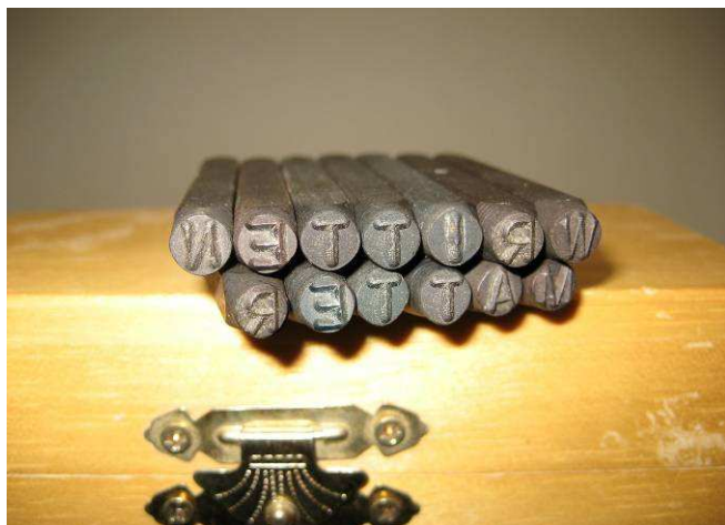
Simon Benson, Written Matter . Foto: Simon Benson