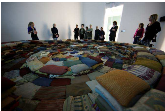
Zaaloverzicht Vreemd en vertrouwd , 2009.