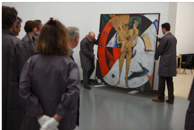
Workshop Replicamuseum ( I for Fake ), Van Abbemuseum, 2009.

op ware grootte van topstukken uit de eigen collectie van het Van Abbemuseum. Samen bedenken en presenteren zij een tentoonstelling in een zaal van het museum. Deze workshop stimuleert de onderlinge samenwerking, het creatieve denken en presentatievermogen en prikkelt alle zintuigen. Op dit moment bestaat het replicamuseum uit twintig grotere en kleinere werken uit verschillende periodes van de kunstgeschiedenis van de twintigste eeuw. Het is de bedoeling dat dit aantal wordt uitgebreid tot vijftig in 2010. In 2011 en 2012 zouden er nog eens vijftig bij moeten komen.