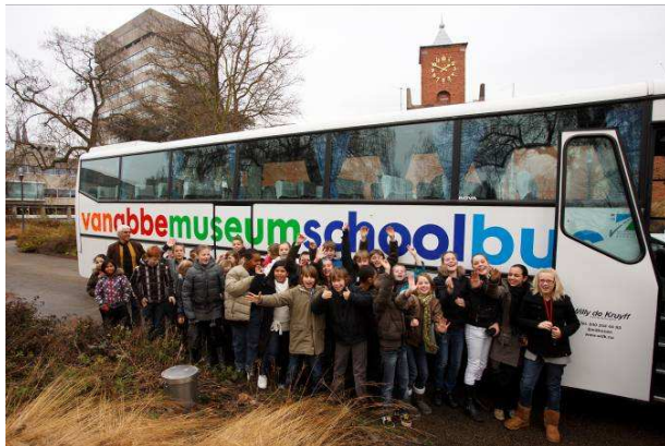
Introductie Van Abbemuseumschoolbus, november 2008.

Het samenwerkingsverband met Rabobank Eindhoven-Veldhoven, dat in 2008 tot stand is gekomen, had als doel gezamenlijk het bestaande scholenprogramma van het Van Abbemuseum uit te breiden. In twee jaar tijd is het aantal deelnemende leerlingen van groep 6 en 8 gestegen van 4000 naar 5310. Doelstelling van het nieuwe contract voor de schooljaren 2010/2011 en 2011/2012 is het continueren van het scholenprogramma en het vervoer met de Vanabbemuseumschoolbus.