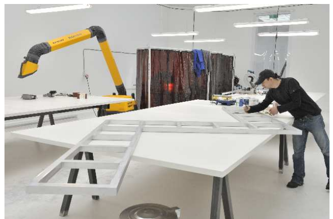
SUPERFLEX, FREE SOL LEWITT , 2010. Zaaloverzicht Van Abbemuseum.

verwijst naar het 'geïnspireerde moment' waarin het is ontstaan.