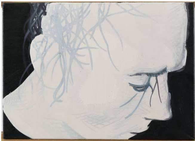
Wilhelm Sasnal, Wojtek, 2005.