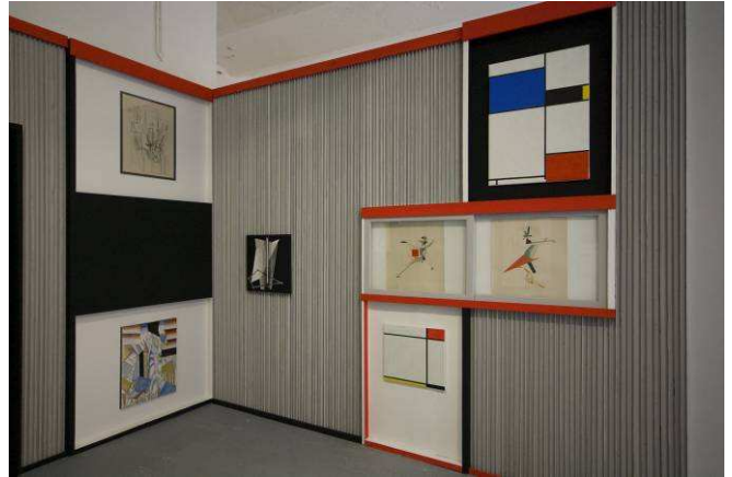
Alexander Dörner & El Lissitzky, Kabinet der Abstrakten , Halle für Kunst Lüneburg 2009, collectie van het Museum of American Art Berlin.

Stokker zelf. Ze toont ze in de ruimte met het door haar ontworpen behang en geeft ze een passende 'omlijsting'.