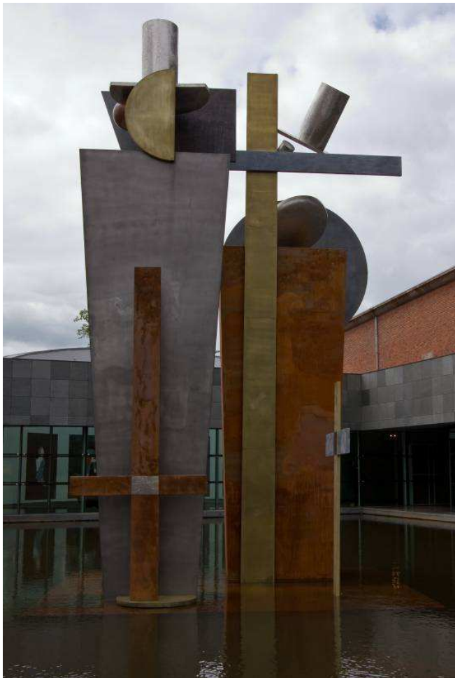
Doodgravers , naar ontwerp van El Lissitzky, Van Abbemuseum, 2009.

Spectaculair is ook de meer dan acht meter hoge sculptuur Doodgravers , die sinds 27 augustus 2009 in de vijver van het museum staat en een van de blikvangers is. Het beeld is vervaardigd uit verschillende soorten metaal.