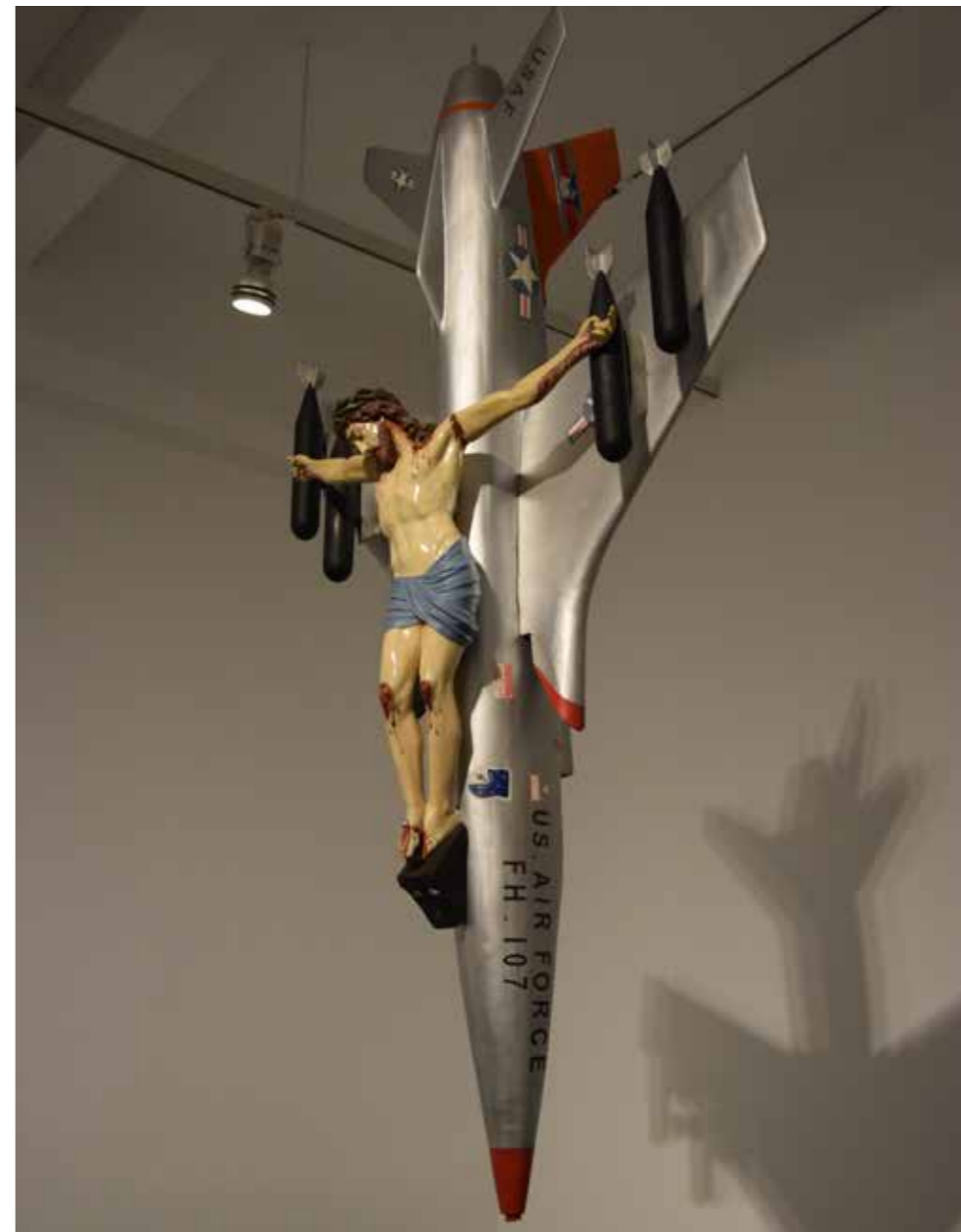
León Ferrari De westerse en christelijke beschaving - 1965 Collectie León Ferrari

Deze in 2013 overleden kunstenaar was afkomstig uit Buenos Aires. Met zijn conceptuele kunstwerken protesteerde hij niet alleen tegen de Argentijnse regering, maar ook tegen het imperialistische westen en de rol van de kerk. Ferrari werkte met hout, beeldhouwwerk, keramiek, fotokopieën en collages. Ook maakte hij vaak gebruik van krantenknipsels en andere teksten. Doordat zijn werk en ideologieën zo controversieel waren en hij werd bedreigd door de militaire dictatuur vanwege zijn extreem links georiënteerde politieke opvattingen, week hij uit naar Brazilië. Met zijn op religie gerichte werken (die betrekking hebben op Christus, de Maagd Maria, of andere symbolen van het katholieke geloof), wekte hij destijds de woede op van katholiek Argentinië en nu ook recent in Spanje. De expositie Een vriendelijke wreedheid