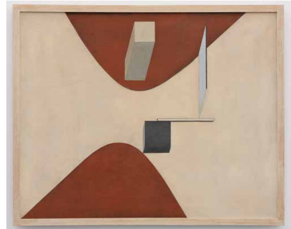
El Lissitzky: Proun P23, NO. 6, 1919