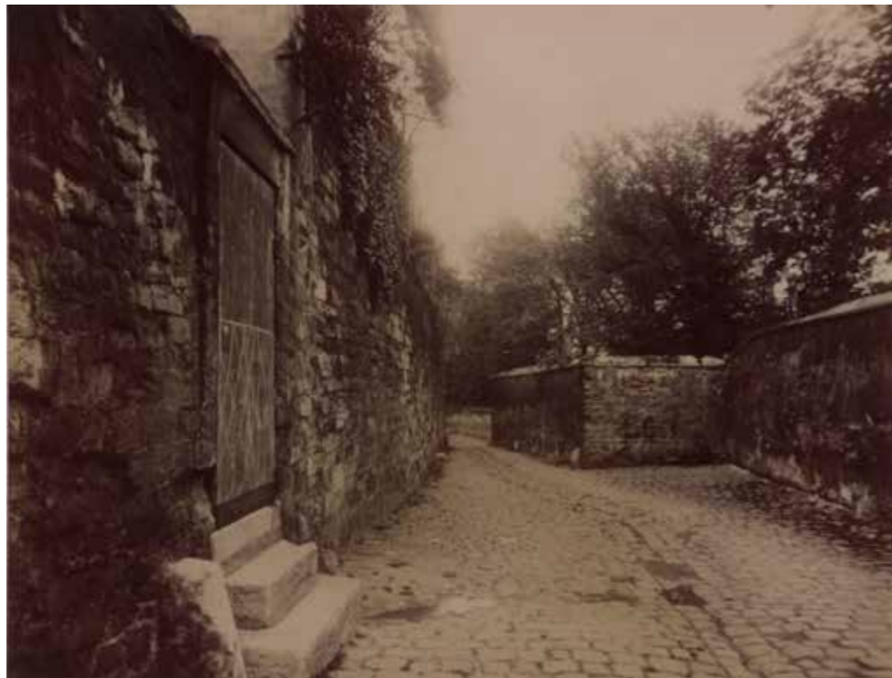
Eugène Atget Un cour de la Rue Berton (± 1910)

fotograaf Man Ray die zich over een groot deel van zijn negatieven en afdrucken ontfermde. Consciëntieus bewaarde ze dat materiaal en deed het uiteindelijk over aan het MoMA in New York. Naar aanleiding van een expositie over fotografie in het Van Abbemuseum in 1976 kocht directeur Rudy Fuchs via een Amerikaanse galerie twee foto's van Atget aan: Pontoise-Ancien Hotel du Tribunal en Un cour de la Rue Berton , beide gemaakt rond 1910.