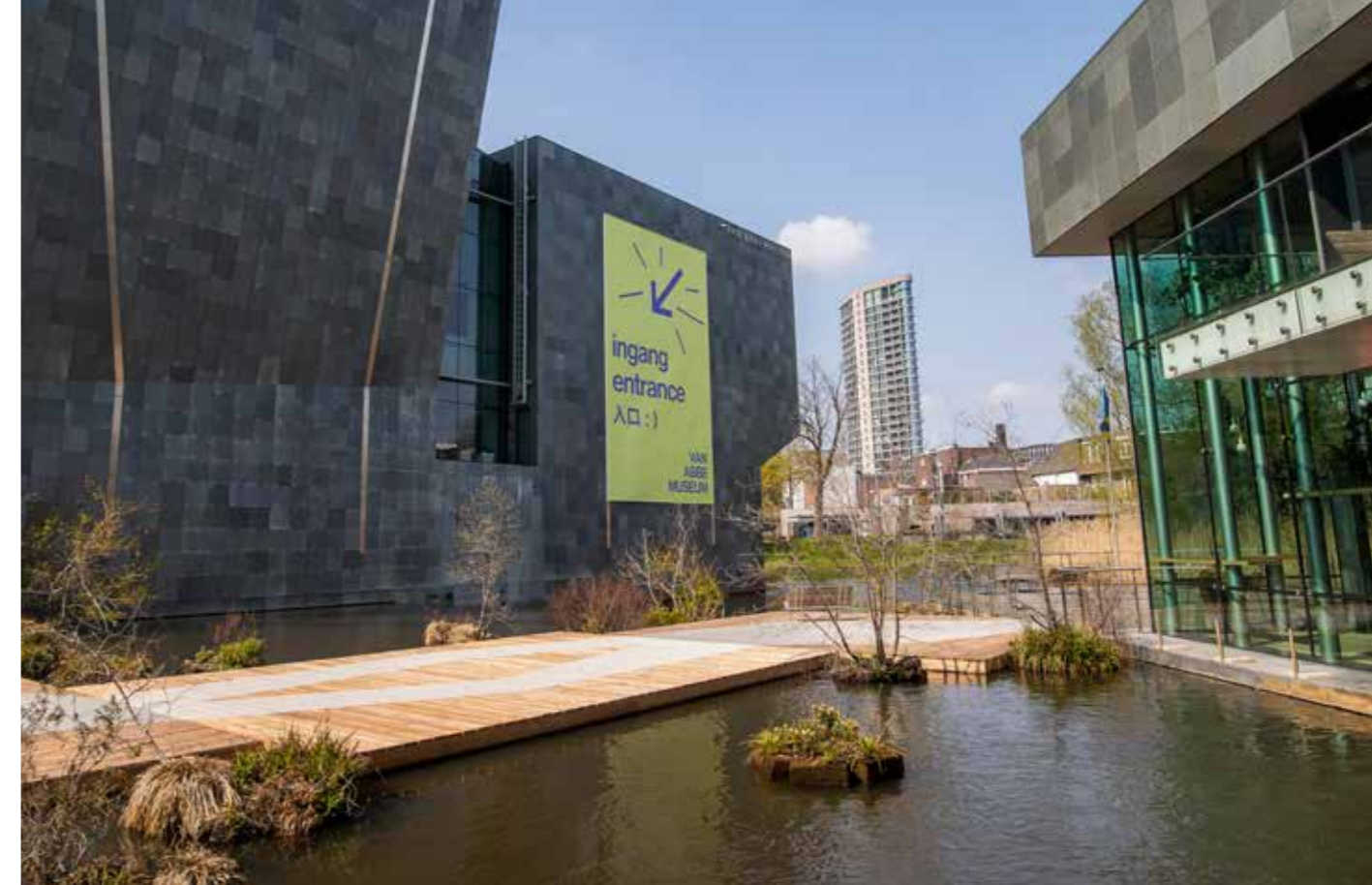
Tijdelijk ingang van het Van Abbemuseum