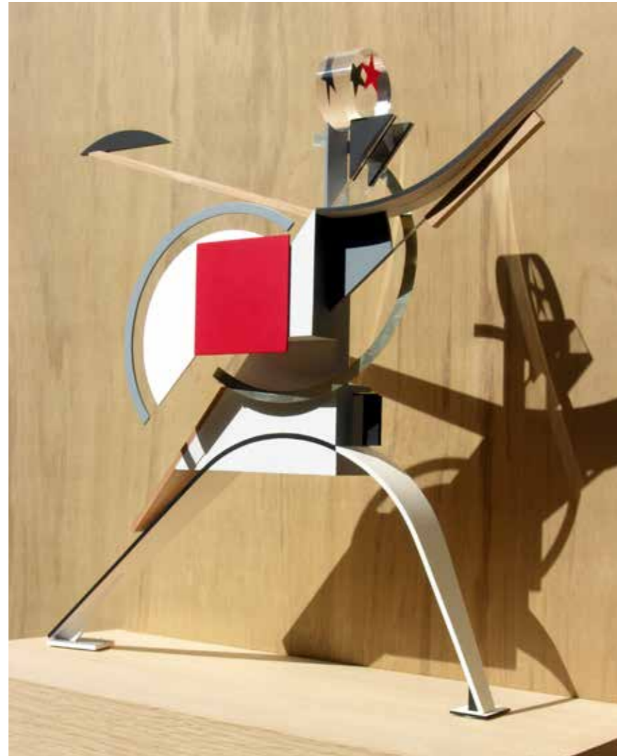
3D interpretatie naar 'Neuer Man (Nieuwe mens)' van El Lissitzky, (1923) reconstructie 2009 Collectie Van Abbemuseum, Eindhoven